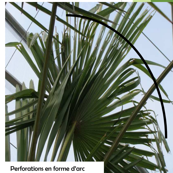
Perforations en forme d'arc