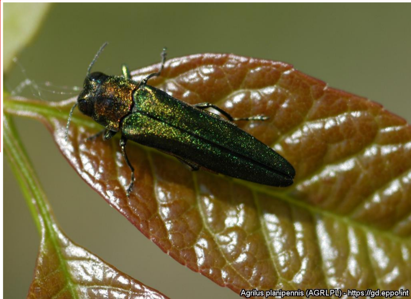
Agrilus planipennis (AGRLPL) - https://gd.eppo.int

Images: Daniel A. Herms, The Ohio State University (US). EPPO Global Database, https://gd.eppo.int